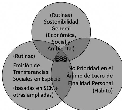
Ilustración 1. Economía Social Sostenible desde el Institucionalismo Económico